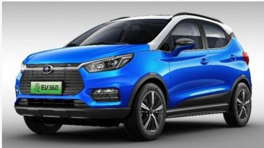
BYD 元 EV360 Webより抜粋