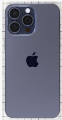
iPhone 15 pro MAX