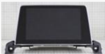
プジョー3008 ディスプレイ部