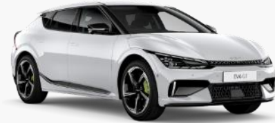
Kia EV6 GT (WEB情報より)