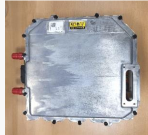
リアインバータ外観