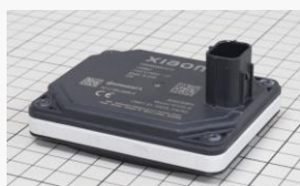
ミリ波レーダー外観