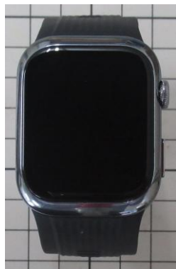
HUAWEI WATCH D2