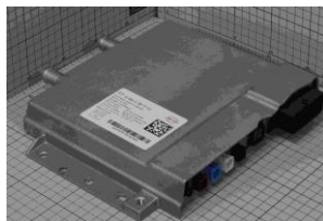
ADAS ECU 外観