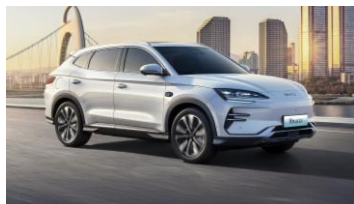
BYD 宋 PLUS EV