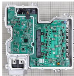
インバータモジュール

(引用) https://www.VOLVOCars.com/jp/cars/ex30-electric/